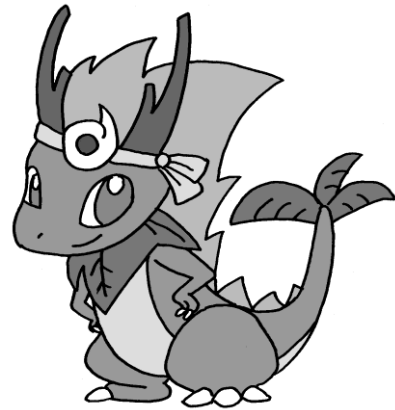
本校のキャラクター「クルル」