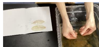
↓メディアセンター作品